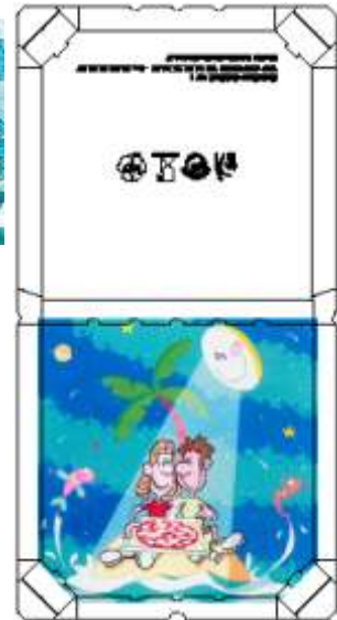
Modèle TR (coins biseautés)