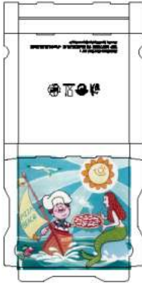
Modèle FR (Coins droits)